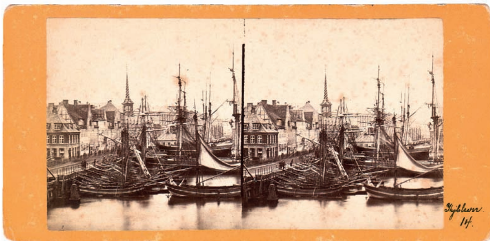
Skibe fra hele Skandinavien – også fra Bornholm – lagde til ved Børsen i København og solgte deres varer til købmænd og grossister. Stereoskopbilledet er et af de tidligste fotografier af det travle liv ved Børsen. Foto Georg E. Hansen, København, 1860'erne. Foto tilhører Peter Randløv.

Om A. P.'s sidste og største kvase »Freya« fra 1876 er fundet i alt 37 optegnelser, hvoraf en stor del efter A. P.'s død i 1889. Også den fulgte i store træk sejlmønstret for de øvrige kvaser, dog synes der at være en større andel af rejser fra Bornholm end for de øvrige kvaser.