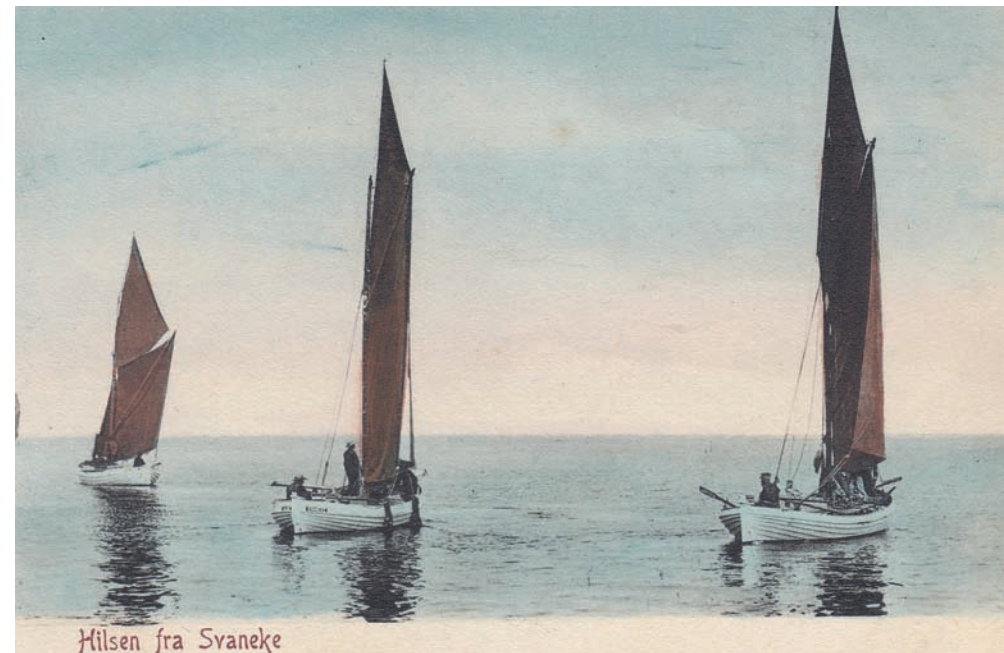
Koloreret postkort af fiskerbåde.