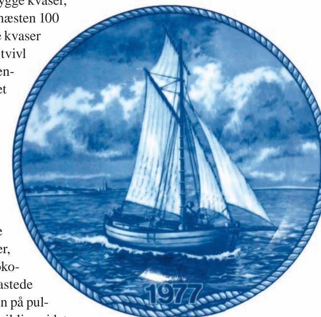
Platte i »Fiskeri-erhvervs-serien«, Tove Svendsen, 1977. Platten er den eneste kendte illustration af A. P.'s kvase »Nicoline«. Ukendt forlæg.

Matroserne har typisk tjent 10-18 rigsdaler om måneden afhængig af alder og kvalifikationer, mens den unge kok typisk har tjent det halve. Kvaseførerens hyre er ikke angivet, men man kan forestille sig, at han har tjent noget mere end en matros. Derudover har han typisk haft andel i kvasen og