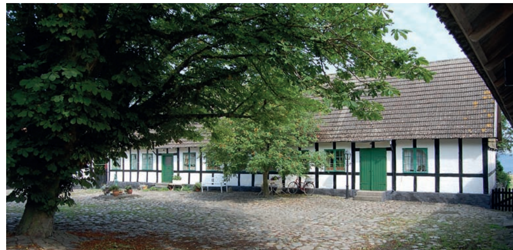
Listedgård sommer 2008.

Hans tilnavn Listedkongen signalerer flere ting. Både magt og en vis egenrådighed, men også en man kunne respektere og se op til. Respekten fra omgivelserne er åbenlys, og han må desuden have været relativt populær i Listed og omegn. Egenrådigheden ses også i, at han ikke tilpassede sig tiden med dampskibe og industri, men at han stædigt holdt fast ved de gamle tider til sin død. Også selv om det kostede ham det meste af hans formue.