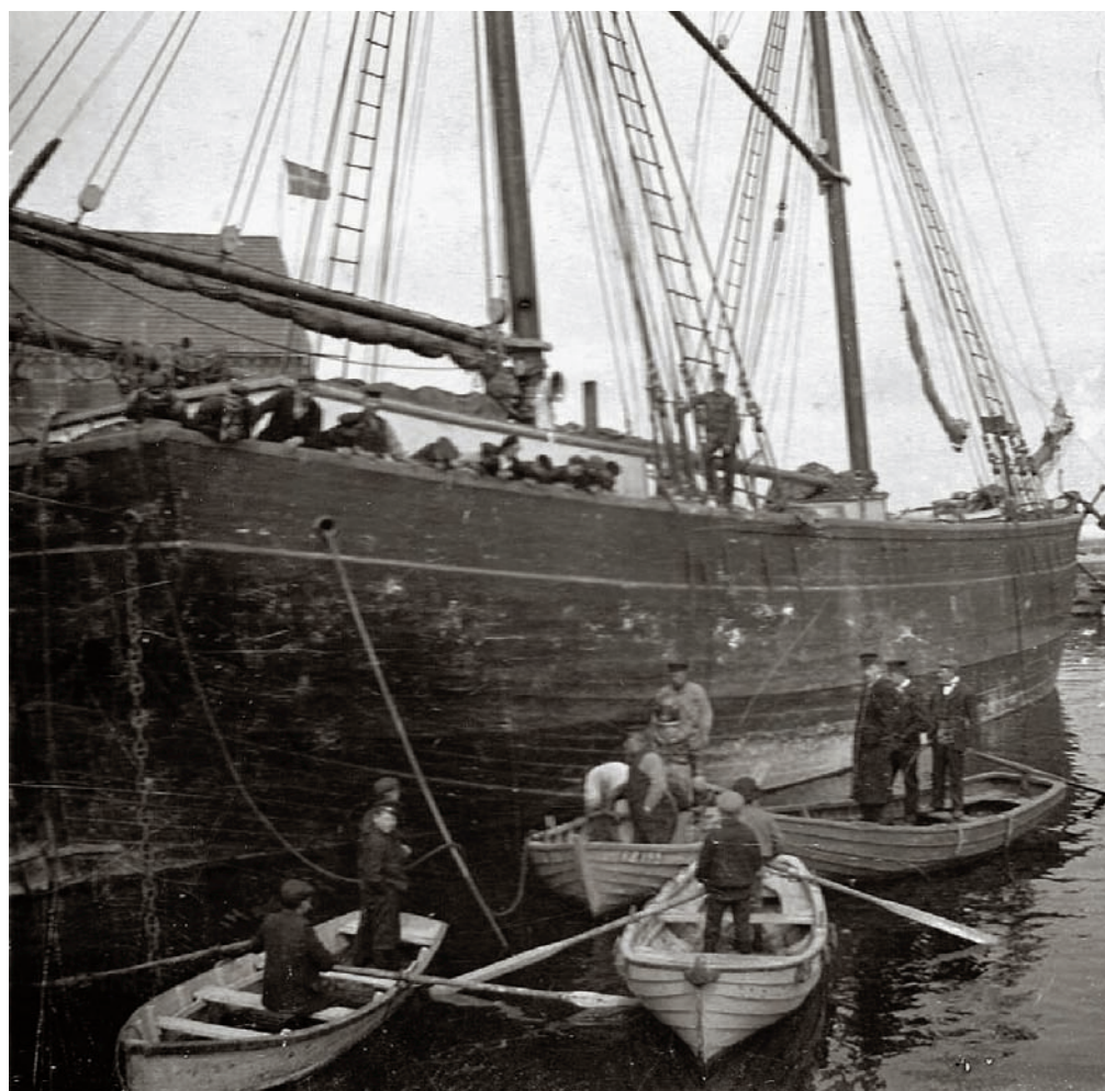
Kadrejere ved skonnert i Allinge. Ene del af et stereoskopbillede.