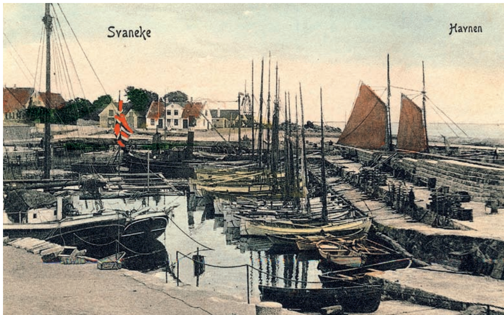
Koloreret postkort af skibe i Svaneke Havn fra omkring 1905. Privateje.

»Margrethe« var gennem årene et familieskib, og det blev i hele dets tid på Bornholm ført af et medlem af familien.