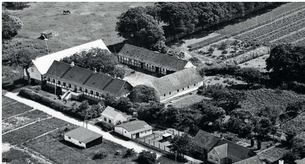
Luffoto af Listedgård 1946.

til havs, som A. P. begyndte i disse år, kom avlsbruget til at betyde relativt mindre som indtægtskilde for familien. Der er dog ingen tegn på, at A. P. mistede interessen for sit avlsbrug, og han opkøbte så sent som i 1887 et mindre jordstykke.