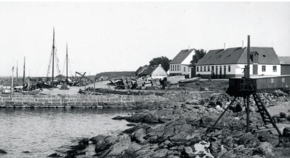
Listed med Strandstien, fra højre nr. 2, Listed Brugs, det grundmurede hus er nr. 4. På den anden side af strædet er bindingsværkshuset Strandstien nr. 6, en ældre bindingsværksejendom, der tidligere var stråtekt og var en del af den større gård, som A. P. Hansen voksede op på.

tages de faa Familier, som have Jord, ere de andre i maadelig Omstændigheder. «